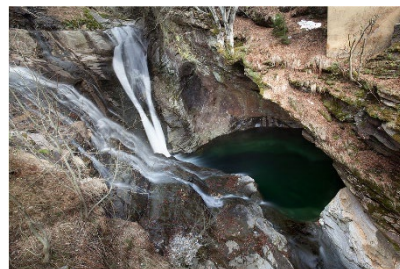
Pozzo Negro e Cascata di Efra

Ripreso il cammino, si attraverserà il "Ponte - Passerella" che collega il paese ai versanti boscosi che cingono il complesso montuoso della Rasiva - Monte Zuccherò, (2684 m - 2735 m) posto tra la Valle Osura, la porzione superiore della Val Verzasca e la Val Redorta, siamo diretti proprio verso quest'ultima valle, seguendo le segnaletiche del