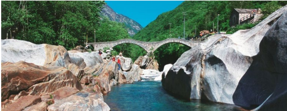
Veduta del "Ponte dei Salti" - Lavertezzo

Attraverso questa escursione, che potremmo considerare la seconda tappa del "Sentierone" andremo a percorrere il tratto finale della Valle Verzasca, il tracciato, ricalca grossomodo, l'antica via percorsa dai contadini per recarsi al piano, permettendo una visione del fiume da punti di vista particolarmente suggestivi; questa porzione di vallata risulterà anche leggermente più antropizzata ed i molti escursionisti che la percorrono, tendono a "concentrarsi" in prossimità degli abitati o presso le attrazioni naturalistiche ... che, come scoprirete ... non mancheranno.