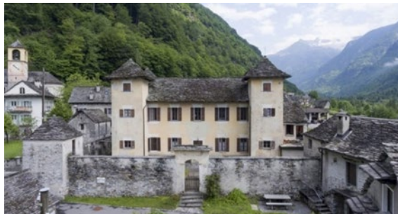
Cà dei Marcacci. [Castello / Brione - Verzasca]

Il percorso sembra avere una sola attrattiva ... ma, sarà la nostra curiosità a "condire" di interesse l'escursione in questo tratto ... l'acrocoro di rocce del "Frugger" aperto su pozze di acqua cristallina ... ma, possiamo assicurarvi che passo dopo passo ... incontreremo molto altro, come la "Lüera di Alnasca" ... e potremmo anche raccontarvi di cosa si tratta ... ma occorre, vedere per credere!