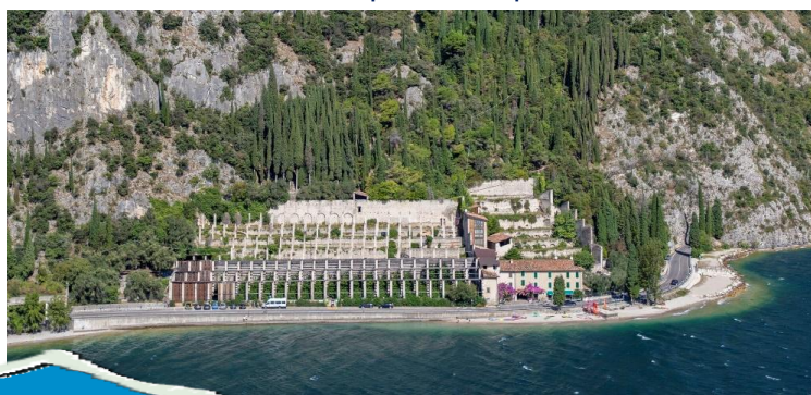
Visuale dall'alto della Limonaia del Prà de la Fam.